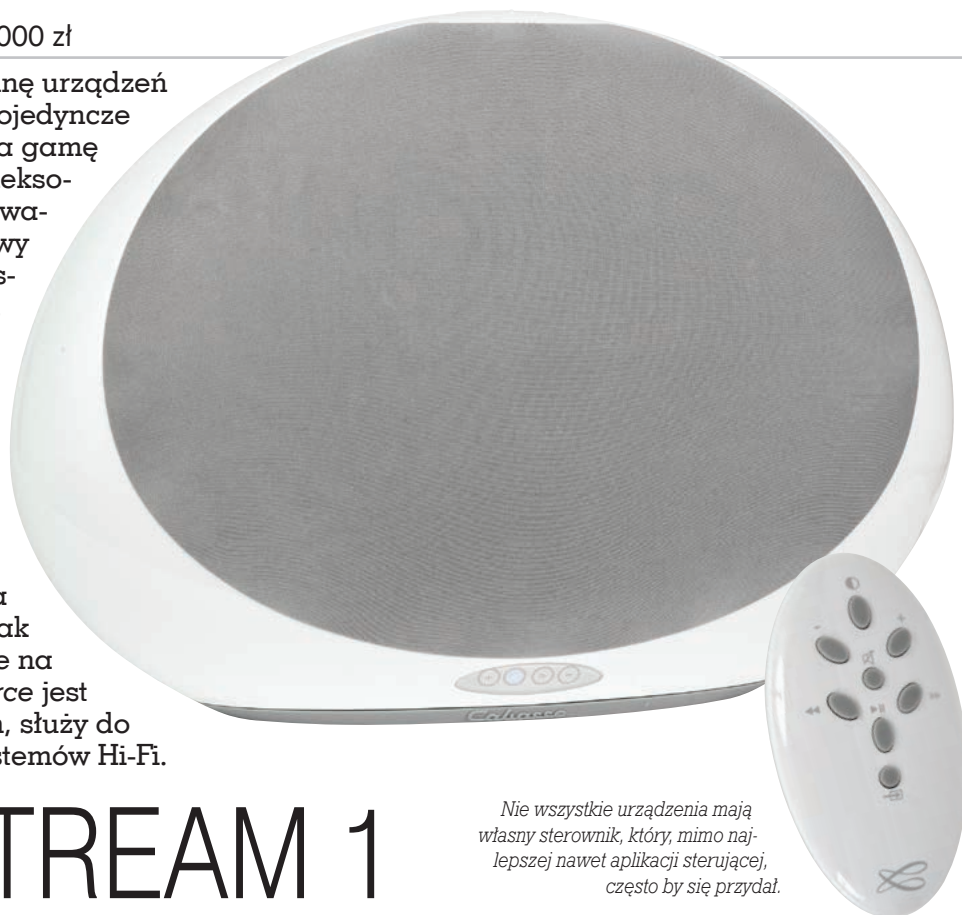
Nie wszystkie urządzenia mają własny sterownik, który, mimo najlepszej nawet aplikacji sterującej, często by się przydał.

W „rodzinie” pojawił się wzmacniacz Stream AMP oraz odtwarzacz Stream Source. Ten pierwszy pozwala na dystrybucję plików oraz sygnałów i wymaga już tylko podłączenia pary kolumn pasywnych. Czego jak czego, ale takich w ofercie Cabasse na pewno nie brakuje. Stream Source jest z kolei surowym źródłem, służy do uzupełniania systemów Hi-Fi.