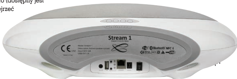
Wszystkie złącza umieszczono pod gumową stopką.