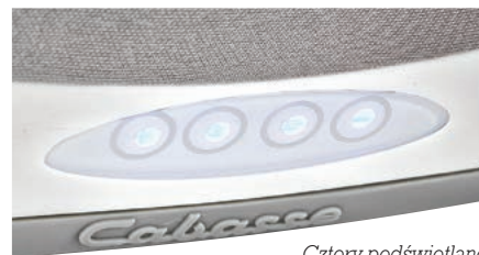
Cztery podświetlane sensory dotykowe pozwalają na wybór wejścia oraz regulację głośności.

Cabasse odtwarza pliki MP3, WMA, WAV, AIFF, Alac oraz Flac, maksymalna rozdzielczość może osiągnąć 24 bity, a częstotliwość próbkowania 96 kHz.